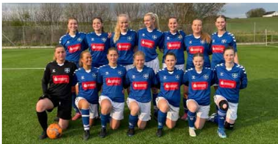
EUI Damer Serie 2 afsluttede med en flot midterplacering i deres pulje.