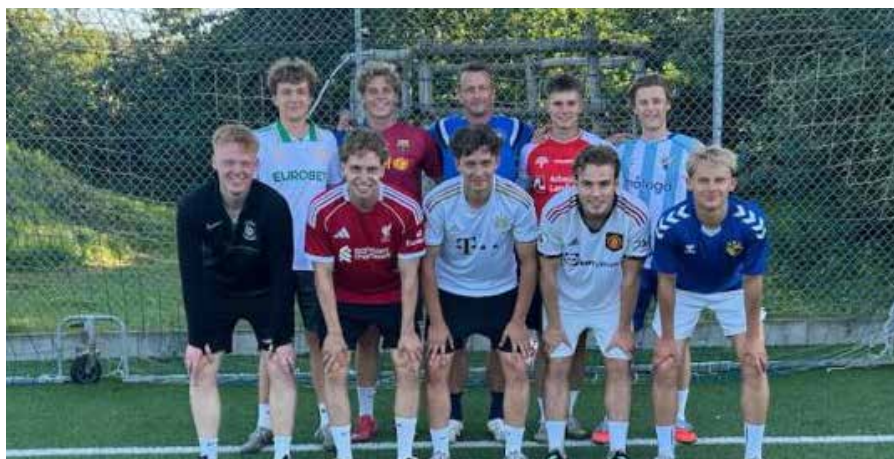
EUI Herrer Serie 3 afsluttede forårssæsonen af med et brag! Hele 8-3 på hjemmebane over Juelsminde.