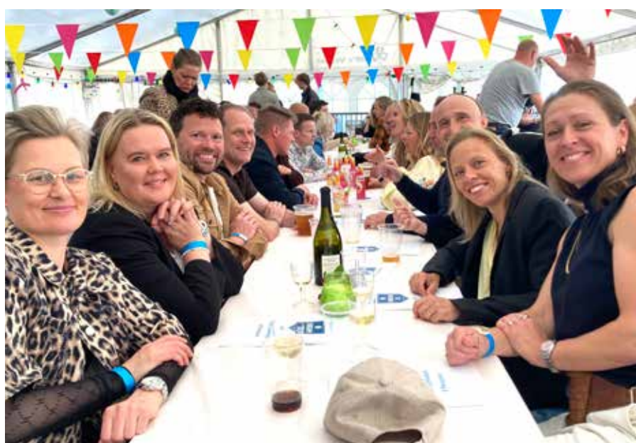
God stemning og masser af godt humør i festteltet.