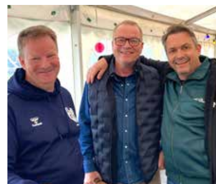
STOR TAK til de mange der mødte frem til morgen for at hjælpe med oprydning efter EUI Sportsfest. Vi nåede i mål med det hele på 2 timer. Virkelig dejligt at mærke opbakningen. Tak for i år - vi ses den 18. + 19. juni 2027.