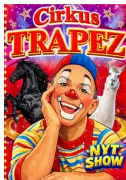
Cirkus Trapez og deres flotte jubilæumsforestilling var en stor succes.