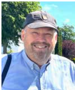
Præstens klumme, Poul Martin Langdahl