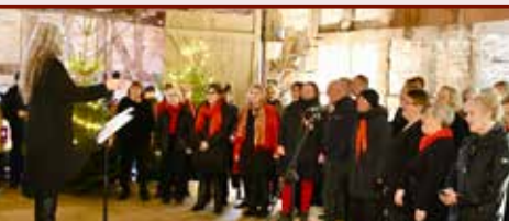
Engum Gospelkor, Tirsbæk julemarked

Som korleder oplever jeg ofte, at energien i sanglokalet fyldes med glad energi, lysende øjne og spontane smil. Når vi synger med hver vores stemme, og klangene smelter sammen i harmonier, sker der nemlig noget næsten magisk, der gør, at vi oplever en større følelse af samhørighed og meningsfuldhed.